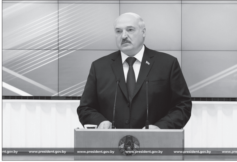
Александр Лукашенко: «Цель – создать прибыльный аграрный сектор»

Как отметил Президент, сегодня стоит задача сделать работу сельхозотрасли более устойчивой, а ее развитие – прогрессивным. Нужно железно расширять производство и экспорт продукции с высокой добавленной стоимостью, развивать национальные бренды, опережая конкурентов. Александр Лукашенко рассказал, какие проблемы есть в растениеводстве и как их исправить, констатировал, что результат прошлого года почти провальный. И вопрос не только в погоде. В ряде регионов не соблюдается разработанная наукой и подтвержденная практикой индивидуальная структура посевных площадей, снижаются объемы внесения минераль-