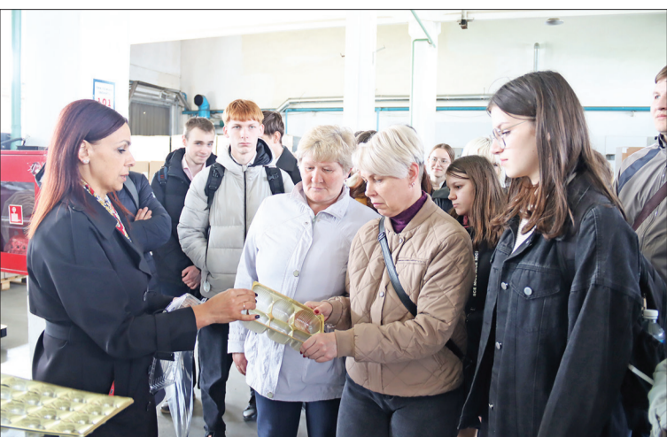
В СП «АМИПАК» - ОАО