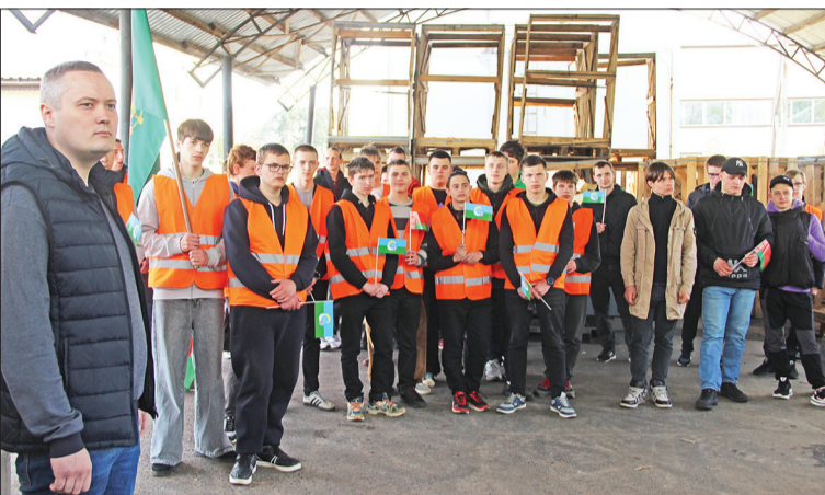
Узнали, как производят пиломатериалы и заготавливают дрова