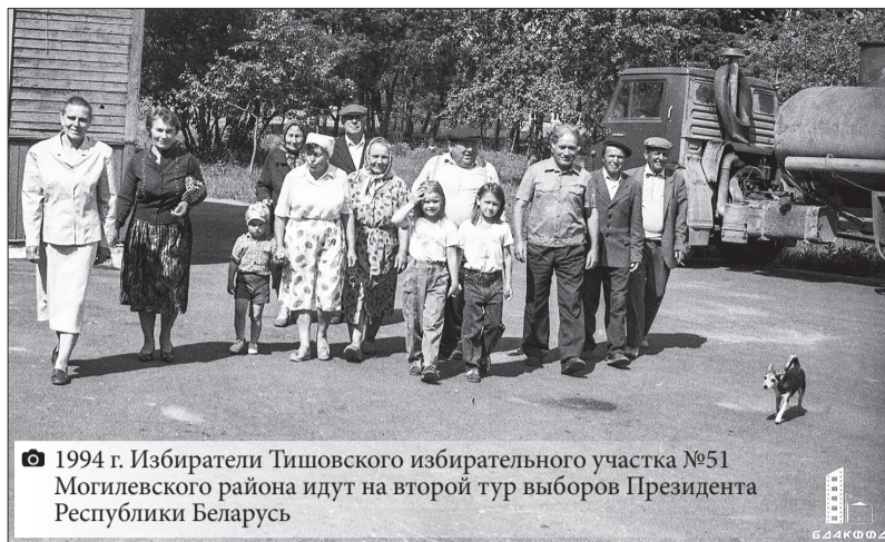
1994 г. Избиратели Тишовского избирательного участка №51 Могилевского района идут на второй тур выборов Президента Республики Беларусь

По материалам БелТА подготовила Татьяна ТИТОРЕНКО