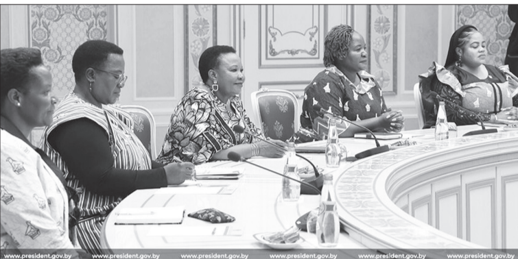
Делегация из Зимбабве под эгидой первой леди