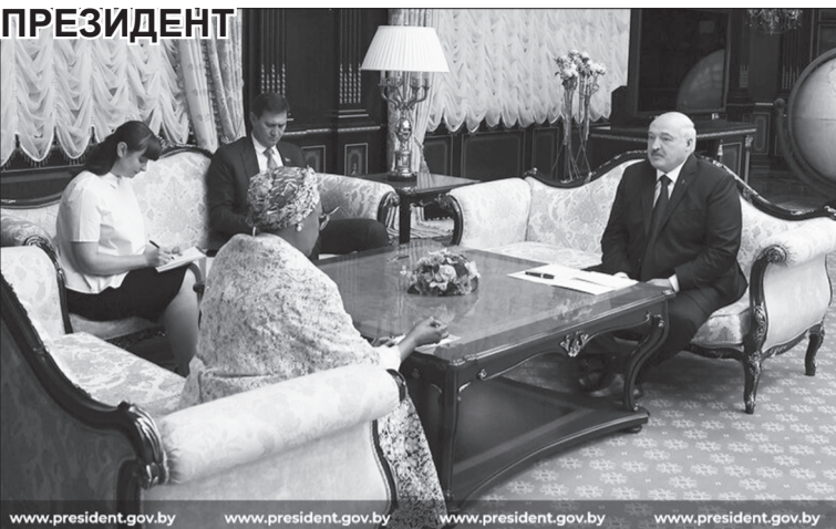
Александр Лукашенко на встрече с первой леди Нигерии