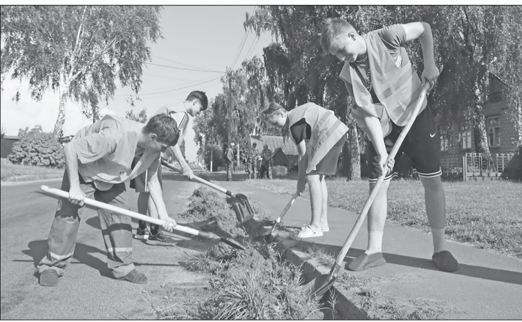
На работу с удовольствием