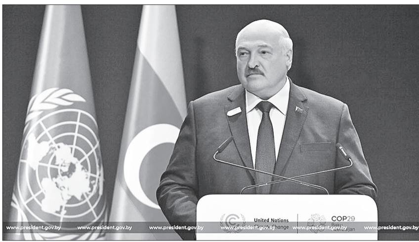
Александр Лукашенко: «Мы жестко выполняем все обязательства, которые взяли на себя»

Обращаясь к тем, кто отсутствует на саммите и думает, что в плане последствий изменения